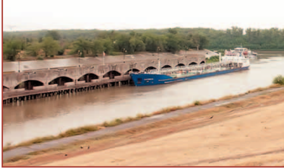
Судно в ожидании шлюзования у стенки гидроузла № 1 ВДСК

логичнее пойти по более простому пути: восстановить имеющиеся на ряде участков подобные «карманы», которые по причине их заиливания сейчас непригодны для эксплуатации. Используя естественный рельеф канала, целесообразно организовать уширения в следующих местах: